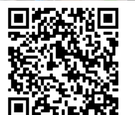
Article « Journée de l'astronomie »