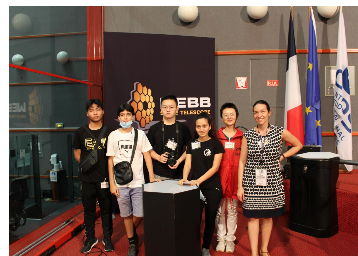
L'équipe Webb dans la salle Jupiter du Centre Spatial Guyanais (CSG)